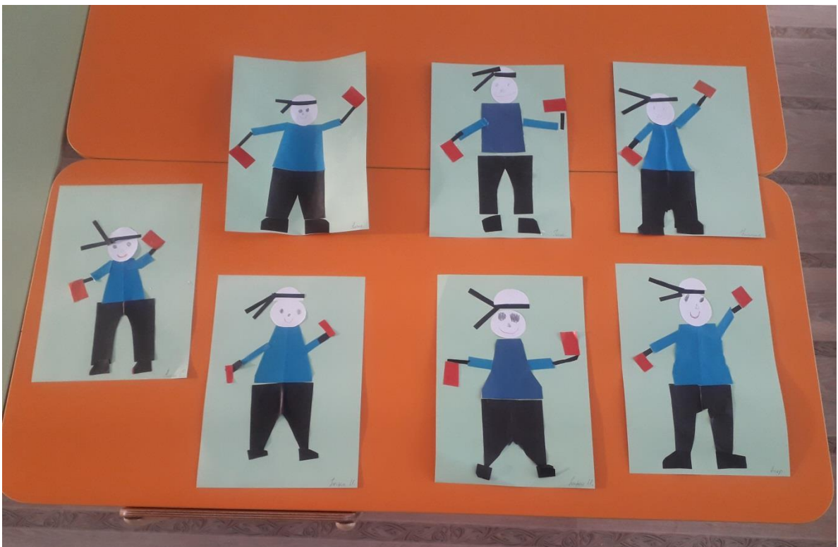
Вот такие замечательные работы у нас получились! Молодцы!