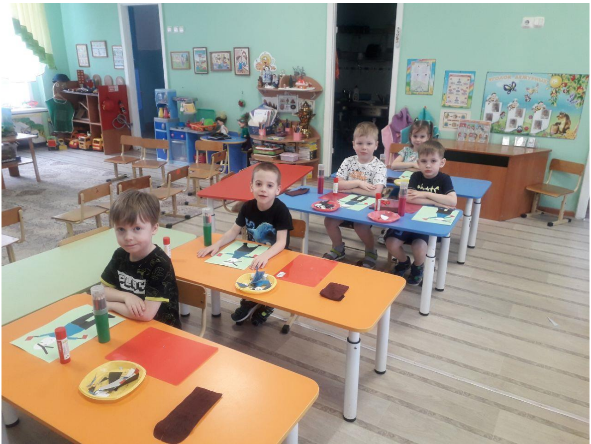
Навели порядок на рабочих местах.