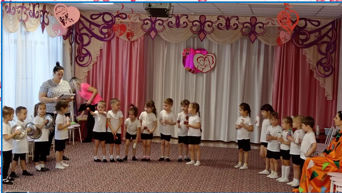
Дети из группы «Капитошки» поздравляли мам игрой в оркестре «Веселая кухня», играли с мамами в игры - аттракционы «Убери игрушки», «Повесим белье на веревку»