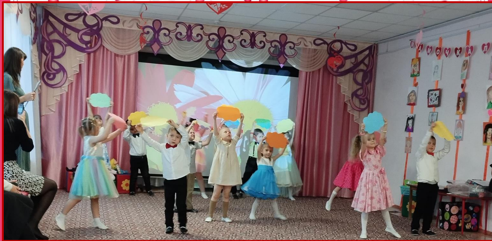
Танец «Все ли можно сосчитать?» Девочки исполнили танец с куклами